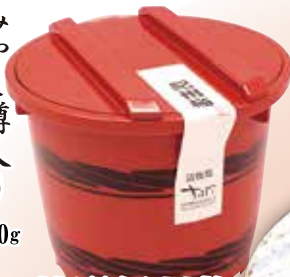
特選紀州梅干 みやこ樽入り