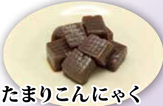
たまりこんにやく

商品No. 171 120g 450円 → 315 円 (税込) 商品No. 172 180g 580円 → 406 円 (税込)