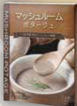
商品No. 943 マッシュルーム