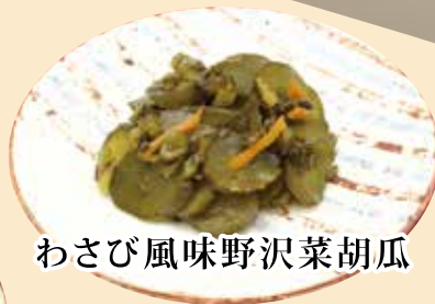
わさび風味野沢菜胡瓜