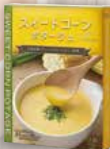
商品No. 942 スイートコーン