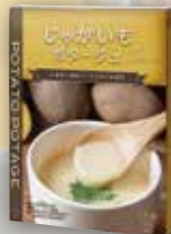
商品No. 944 じゃがいも