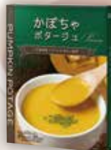
商品No. 945 かぼちゃ