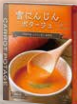
商品No. 941 雪にんじん