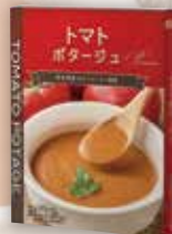
商品No. 946 トマト

国産こだわり野菜の ポタージュスープ 単品 各一人前(150g) 600円 → 420円 (税込)