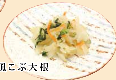
浅漬け風こぶ大根

※セット内容は予告なく変更になる場合がございます。 あらかじめご了承の上、ご注文下さい。